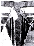
... von Ono Ludwigs Foto eines Gebäudes